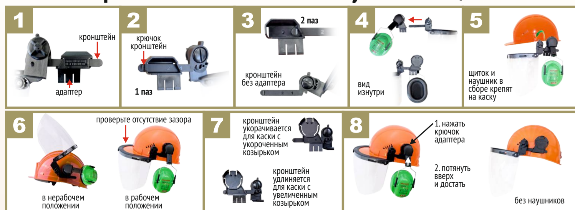
Схема сборки комплекта: каска + наушники + щиток КБТ