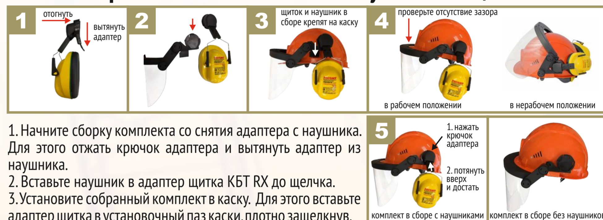
Схема сборки комплекта: каска + наушники + щиток КБТ RX

Все защитные лицевые щитки КБТ поставляются в комплекте с адаптерами.